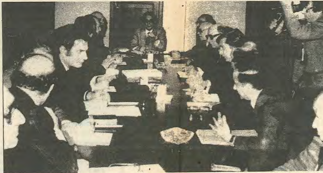
Ο Κυπριακός ενημερώνει τους αρχηγούς και εκπροσώπους των κομμάτων μετα την αποτυχία της συνάντησης «υψηλού επιπέδου».

Στο ερώτημα ποιος φταίει για την αποτυχία, το εργατικό κίνημα δεν πρέπει να πέσει στην παγίδα του να συζητά κατα πόσο φταίει ο Κυπριακός ή ο Ντενκτάς. Αυτό είναι μόνο η επιφάνεια. Στη βάση της αδυναμίας του Ντενκτάς και του Κυπριακού να συμφωνήσουν βρίσκεται η ασυμφιλίωτη σύγκρουση συμφερόντων των Ε/Κ με τους Τ/Κ αστούς.